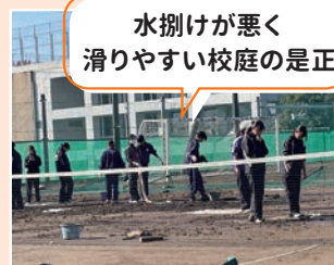
水捌けが悪く滑りやすい校庭の是正