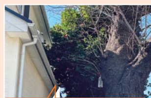
公園の木が住宅に突き刺さる