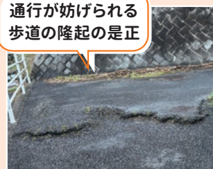
通行が妨げられる歩道の隆起の是正