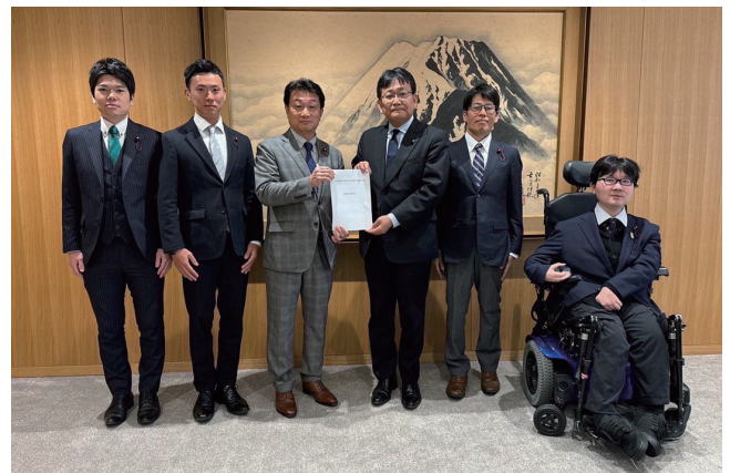
会派として要望書を提出